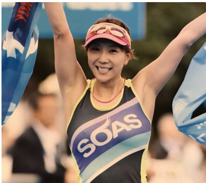
2017村上・笹川流れ国際トライアスロン大会 年齢別にて準優勝