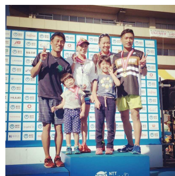
※本人は後列左から2番目